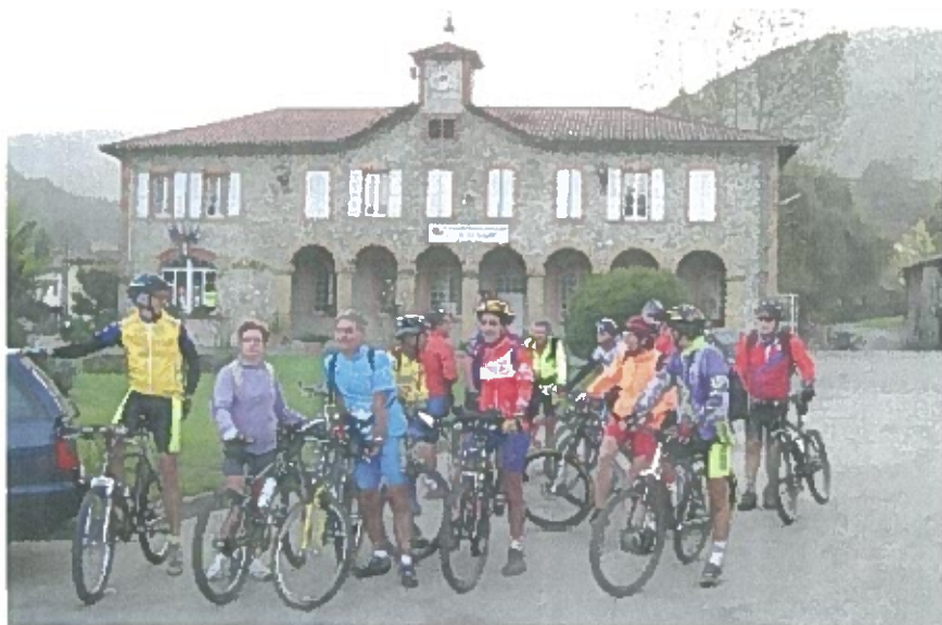
Arbas groupe VTT