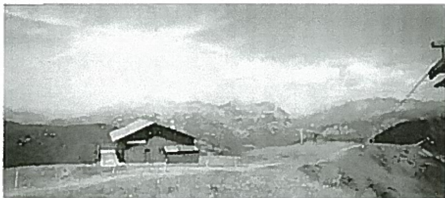
Les Aravis (73) 1486m.